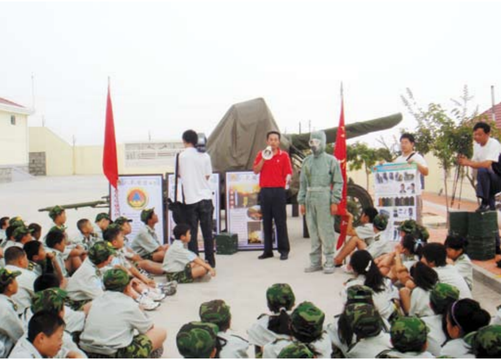
人防宣传教育基地建设得到发展

息化防护总体规划》。截止今年上半年，全省拥有人防专业队伍、人口疏散志愿者队伍数万人，依托人防系统自身力量建立了18支数百人的人防机动通信保障专业队，形成了坚强可靠的防护救援力量。