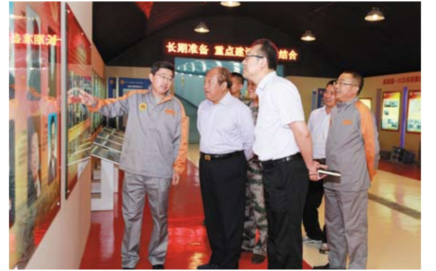
徐振溪副市长参观人防宣传教育展厅

第四，在惠民利民方面相融合。让群众受益是对我们党群众路线最朴实的理解和最有效的实践。应不断强化人防部门的社会管理和公共服务职能，积极开发各类人防工程的惠民利民功能，尽可能多地为群众提供交通、停车、商服、仓储、宣教、休闲等方面的服务，让群众切身感受到人防带来的好处，增强对人防工作的认同感，真正打造“百姓身边的人防、群众放心的人防”。一是可积极推行“人防工程+地下商业与公共服务+地下停车场”的连片规模开发模式，形成区域性人防产业带，促进服务业发展。二