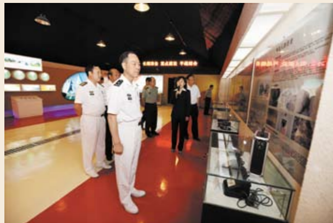
国家人防办领导参观青岛人防宣传教育展厅