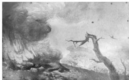
日军轰炸后的石臼所废墟