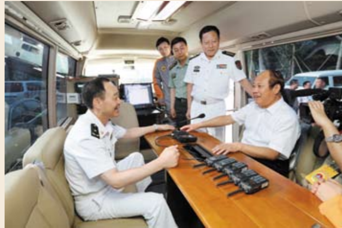
国家人防办领导听取青岛人防机动指挥系统介绍