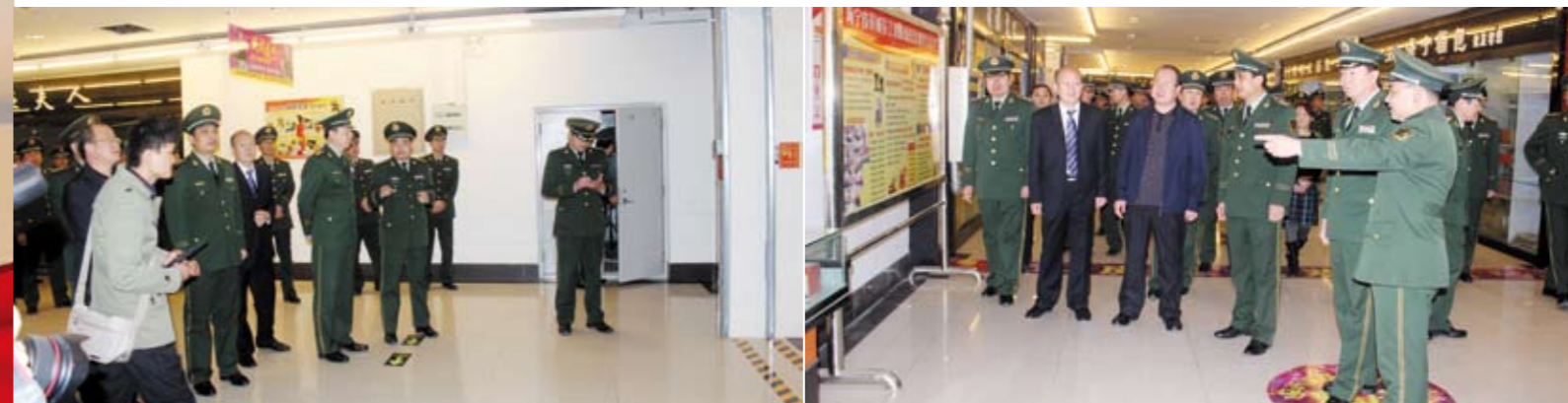
消防部门检查指导人防工程防火工作