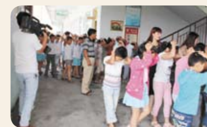
听从指挥，沉着冷静，安全有序，疏散逃生避险的技能；切实增强了在校师生的自救互救能力和快速反应能力。(王保钦)

房墙角、教室桌边等安全区域进行紧急避险。2分钟后，老师迅速引领学生捂鼻、弯腰、抱头紧靠墙体小步快走，按照预先设定的疏散路线紧张有序、快速撤离教学楼，并安全到达指定区域，整个过程仅用3分多钟。疏散演练结束后，台儿庄区人防办还向在校师生赠送了1000余本《防空防灾知识宣传手册》。通过这次活动，使师生们进一步学习了防空防灾教育知识；掌握了在遇到自然灾害及突发事件时