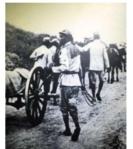
1944年8月，八路军胶东部队收复大泽山

1945年8月26日夜，胶东军区五师十三团在兄弟部队配合下，向盘踞即墨城拒降的日伪军发起猛烈进攻，