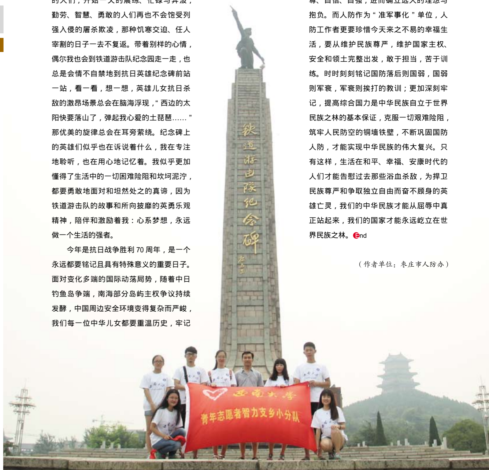
作者(中)和西南大学青年志愿者智力支乡小分队在一起