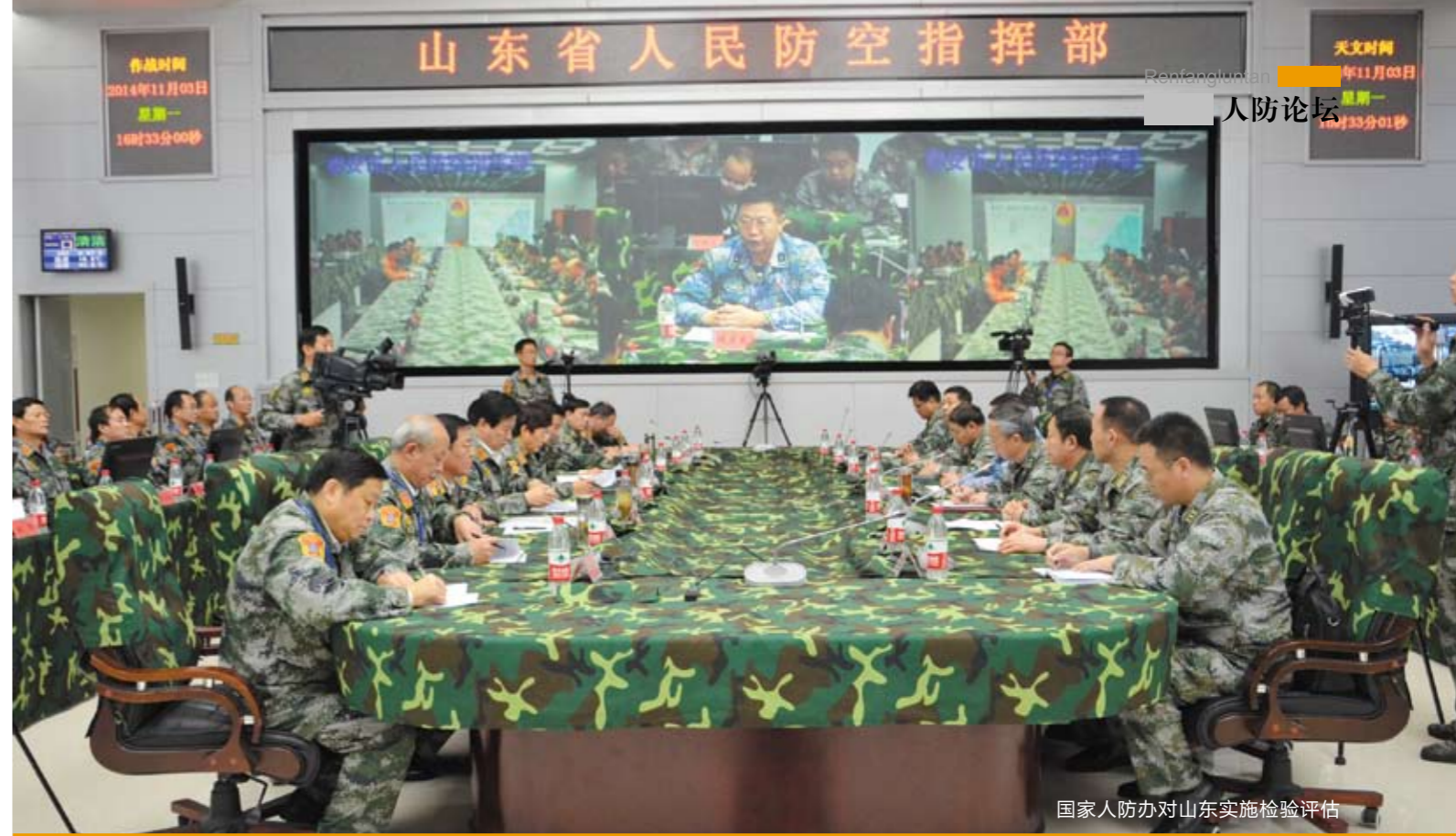
国家人防办对山东实施检验评估