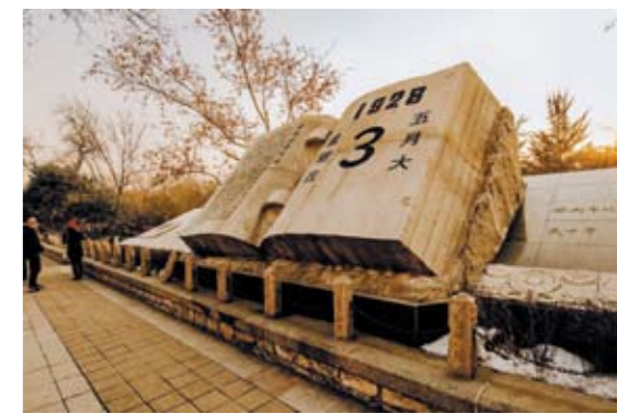
济南“五三惨案”纪念碑