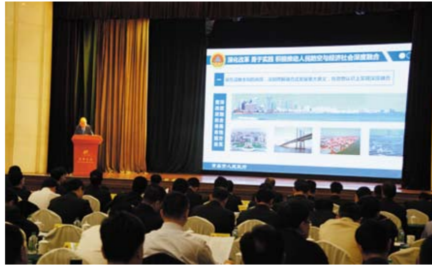
徐振溪副市长在全国人防集训会议上授课式发言

推进“防空防灾一体化”建设，做到资源共享、信息互通、整体联动，真正在救灾防灾方面实现深度融合。青岛市投资1800万元按照国际先进、国内一流标准全面升级改造人防应急指挥中心信息系统，使其具备了与政府应急系统、部队信息系统的联网指挥调度、多网融合通信、远程集成控制的功能，基本实现了信息领域的高度融合。