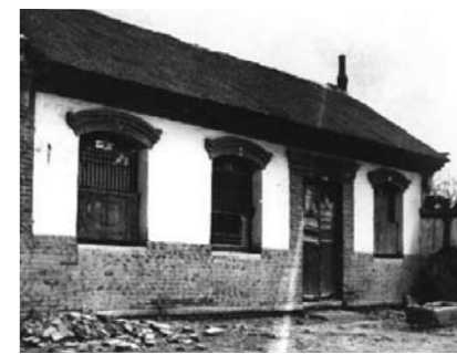
攻打柳疃时的指挥部

隐蔽于南关阁子上。7时许，日军一辆中型吉普车驶入伏击地段，突击队员一起开火，敌车驾驶员当场毙命，汽车翻入公路南侧。突击队员将一名顽强抵抗的日军军官劈死，另一名日军拔腿向三里庄方向逃去，突击队员将其击成重伤。受伤日军逃入村中，被村民发现，大家手持铁锹、叉子等农具把鬼子团团围住，一会儿就把鬼子砸死了，战斗胜利结束。