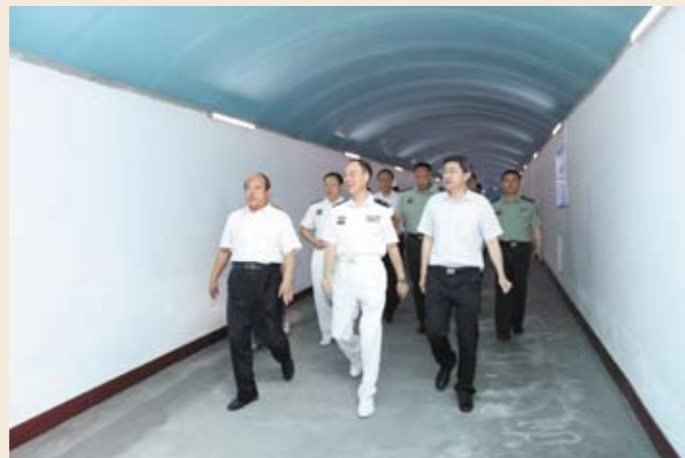
国家人防办领导进入人防宣传教育展厅