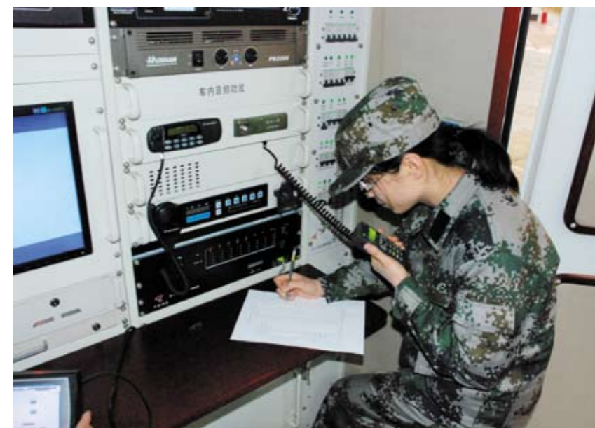
烟台市市级人防机动指挥所在通信联络

烟台是山东半岛重要的濒海城市，也是守卫京津的海上右翼门户，地理位置非常重要。一旦有事，烟台即成为战略防御的前沿阵地，城市防空的任务使命相当艰巨。组建一支战时能力强、平时作为大的人防专业队伍，按照实战化标准组织人防训练演练，成为新时期人防军事斗争准备的必然要求。训练为战争而准备。“仗怎么打，兵就怎么练”，这一直是烟台市人防训练的指导思想。本次拉动训练采取“贴近实战，预设科目，导训结合”的方式，完全按照实战化要求组织实施。一是情况设想真实。烟台市是重要的区域经济中心和海上交通枢纽城市，重要经济目标数量众多，是战时敌空袭的重要目标。训练以“某重要经济目标