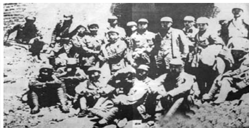
1938年12月，中共日照县委在小曲河建立，对外称“八路军二支队日照办事处”