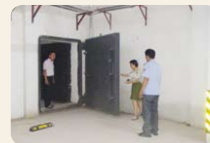
措施落到实处，使人防工程安全渡汛。(金乡县人防办)