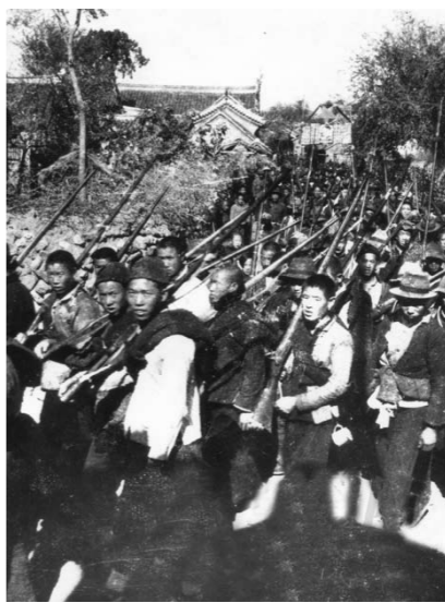
胶东特委举行天福山起义

约莫到了三点多钟，天空飘起了雪花。由于特务队的顽强抵抗，敌人一直没能冲进来。但是，情况越来越严重，敌人的后续部队又来了三百余人，火力也越来越猛。特务队几名同志只得由院内撤到屋里，依房拒守。因子弹不多了，屏住气守卫在门窗两旁，不再轻易射击。敌人趁机缩小包围圈，接近庙墙和爬上屋顶。“哇哇哇”几声怪叫，几支枪同时伸进窗口，特务队的同志在窗内猛地抓住枪管往里拽，敌人使劲往外拉，形成了隔墙搏斗。“咚咚咚”，房顶上也响起了脚步声，并听到“哗啦哗啦”的掀瓦声。特务队的同志于是朝着有响声地方“啪啪”几枪，只听随着几声惨叫，屋顶上呼呼隆隆一阵滚动声。为了发扬火力，同志们一边战斗，一边用刺刀在墙上挖枪眼。敌人的火力只能封锁门窗，封锁不住枪眼，特务队的同志就从枪眼里向外射击，打得敌人再也不敢贴近墙根、窗口了。