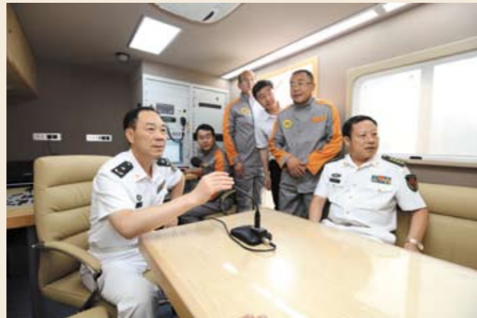
利用机动指挥系统进行跨区调度