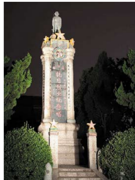
日照县抗日烈士纪念馆

莒城战役。1944年11月14日，山东军区集中一万多兵力，编为攻城、打援和攻击外围据点等梯队，以里应外合方式，发起解放莒城战役。29日守敌弃城逃跑，八路军遂收复莒县全境。延安的《解放日报》专门发表社论指出：莒县的解放，不仅是山东区辉煌的胜利，也是敌后我军的大胜利