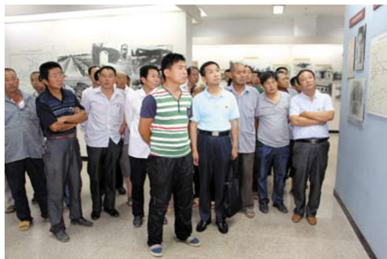
帮包村党员认真观看冀鲁豫边区革命纪念馆革命先烈事迹展览

命财产安全，平时能够防灾减灾和提供停车场所、缓解交通压力，以后要大力宣传人防、支持人防建设”。