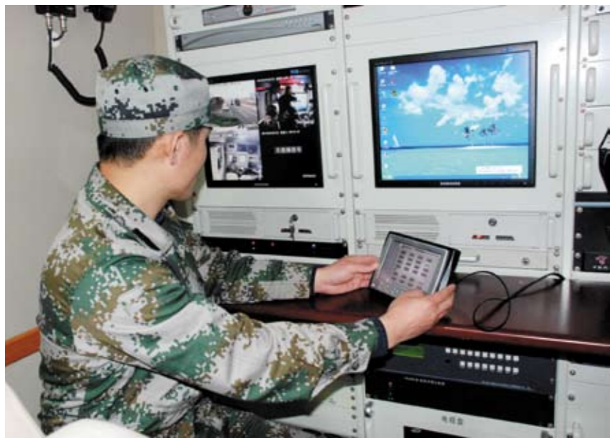
烟台市市级人防机动指挥所在集中调度

附近开阔地带。车载通信设备和视频采集设备早已进入工作状态。根据现场情况，濒海01对各车辆进行了任务部署，有的负责通信保障，有的负责信息采集。经过一番忙碌，濒海12的屏幕上清晰的显示出现场画面，听到了来自第一现场的声音。指挥人员全神贯注地观看事态进展。