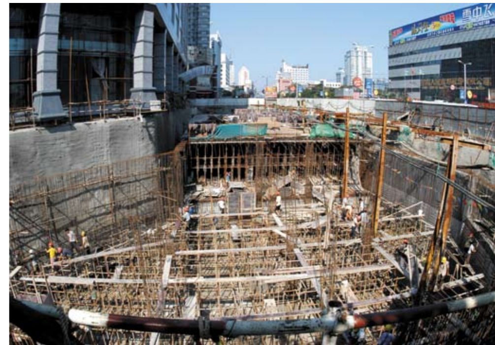
坚持人防建设与城市建设相结合

(四) 宣传教育工作蓬勃开展。充分利用防空警报试鸣日、防灾减灾日等时机扎实开展人防宣传工作，仅2014年全年接受人防教育人数达314.55万人次。认真落实国家教育部、总参谋部、总政治部要求，在学生军事训练中开展了防空知识教育和技能训练。淄博市首创的人民防空警报手语规范，经国家人防办、中国残联评审通过，在全国推广使用，为特殊人群接受空