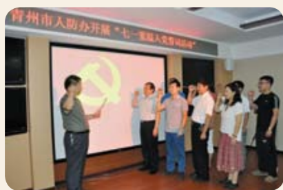
为庆祝中国共产党建党94周年，继续扎实推进“三严三实”专题教育

活动深入开展。6月29日，青州市人防办组织全体党员到廉政教育基地参观学习，重温党史、缅怀先烈，接受革命传统教育。通过一个个鲜活的事例，大家深刻体会到“坚定信念、艰苦奋斗、百折不挠、顽强拼搏”的革命精神内涵。坚持党的群众路线、围绕各自工作领域，勤思廉洁，真抓实干，勇于担当，以实际行动践行“三严三实”，正者更正，歪者纠偏，迷途知返，