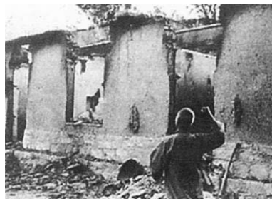
血洗后的田庄成了一片废墟，景况极为凄凉、悲惨