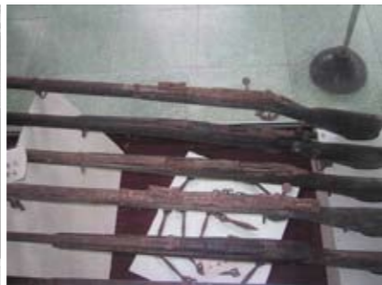
天福山起义时用过的枪支